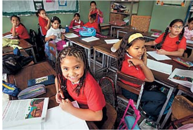
Os colonizadores são os vilões. A cartilha chavista já é aplicada em 25% da rede de ensino, caso da escola Pedro Felipe Ledezma (foto): o nível das aulas é péssimo

A cartilha bolivariana que Hugo Chávez está implantando nas escolas públicas de ensino básico da Venezuela chama atenção pelo excesso de ideologia e pela fragilidade acadêmica. De inspiração cubana, ela pinta os colonizadores espanhóis como vilões, muda a regra de brincadeiras para que elas deixem de ser competitivas e propõe que as aulas de educação física troquem o vôlei por arco-e-flecha – "com o objetivo de valorizar os povos indígenas". Hoje, cerca de 6 000 escolas já adotam boa parte dessa cartilha, o que representa 25% do ensino básico do país. O plano de Chávez é oficializá-la, de modo que chegue a todos os colégios – públicos e particulares. No ano passado, o governo anunciou que faria isso por meio de um decreto. Diante de protestos veementes, decidiu recuar. Atualmente, a parte da rede pública simpática à cartilha bolivariana tem a liberdade de escolher o que aplicar dela na sala de aula. Não satisfeito, Chávez vai submeter a questão a um plebiscito no ano que vem. "As chances do governo são remotas, mas, caso passe, a lei significará um retrocesso", avalia o pedagogo Leonardo Carvajal. Basta olhar para os resultados das escolas que já adotam o currículo. Elas obtiveram as piores notas numa aferição recente sobre a qualidade do ensino na Venezuela. Isso não parece abalar a determinação chavista. Como já disse publicamente um ex-ministro da Educação de Chávez: "Estamos, sim, politizando a educação. E daí?".